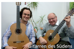
Gitarren des Südens

Kulinarisch kann man sich in den Zwischenpausen an Käse, Baguette und Wein erfreuen.